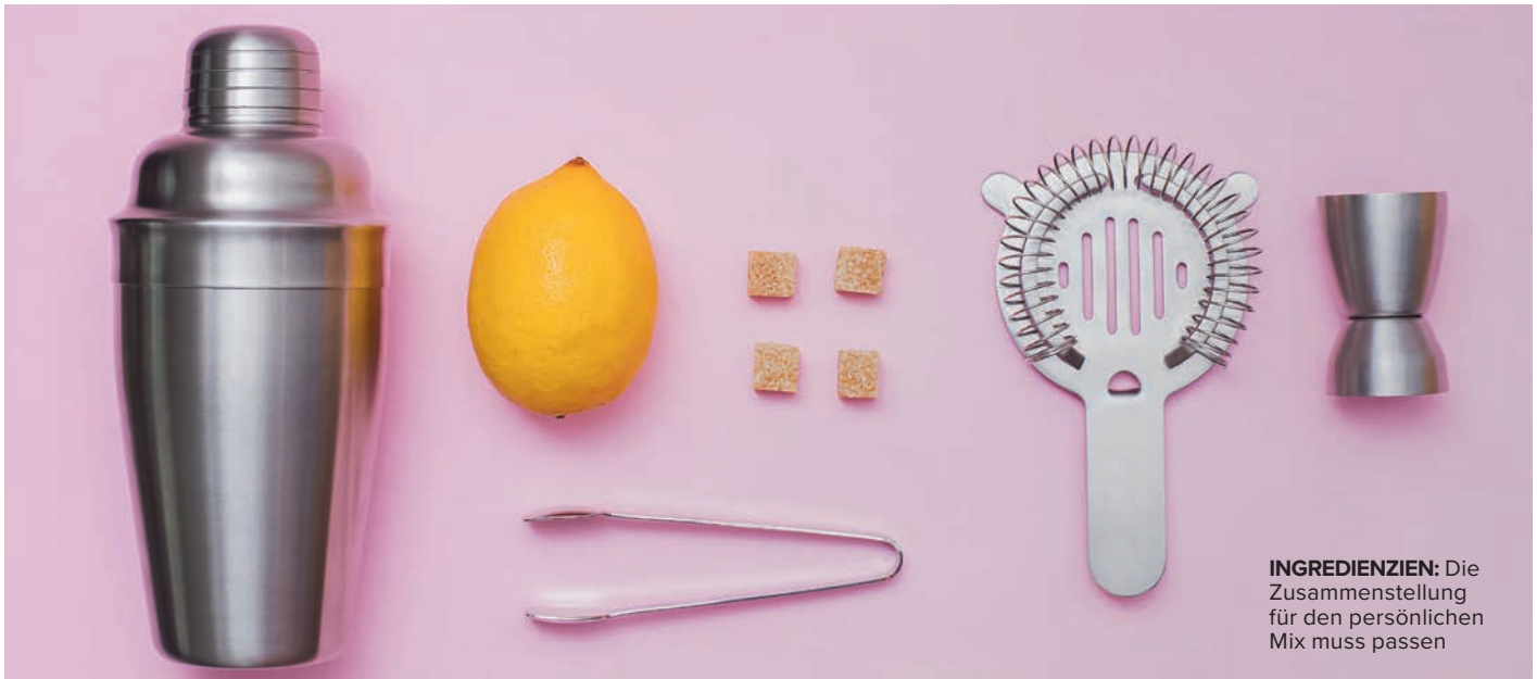
INGREDIENZIERN: Die Zusammenstellung für den persönlichen Mix muss passen